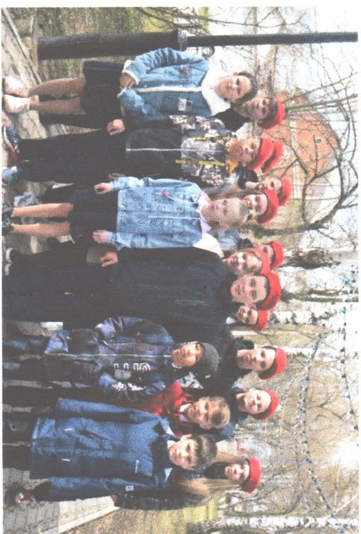
После мероприятия в парке