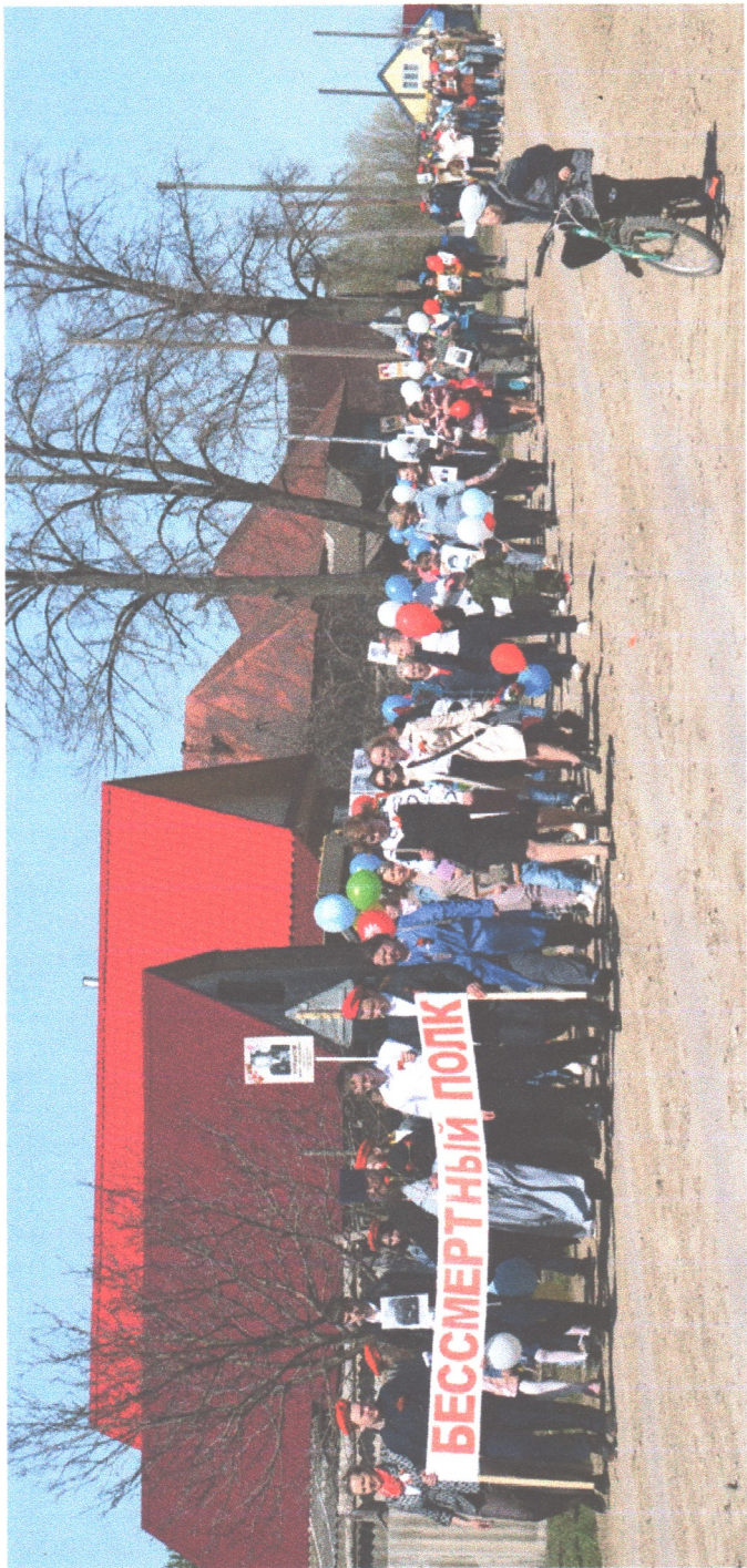
Акция «Бессмертный полк» в этом году была многочисленной