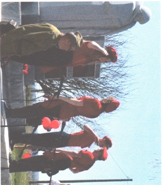
Смена караула у памятника воинам-односельчанам