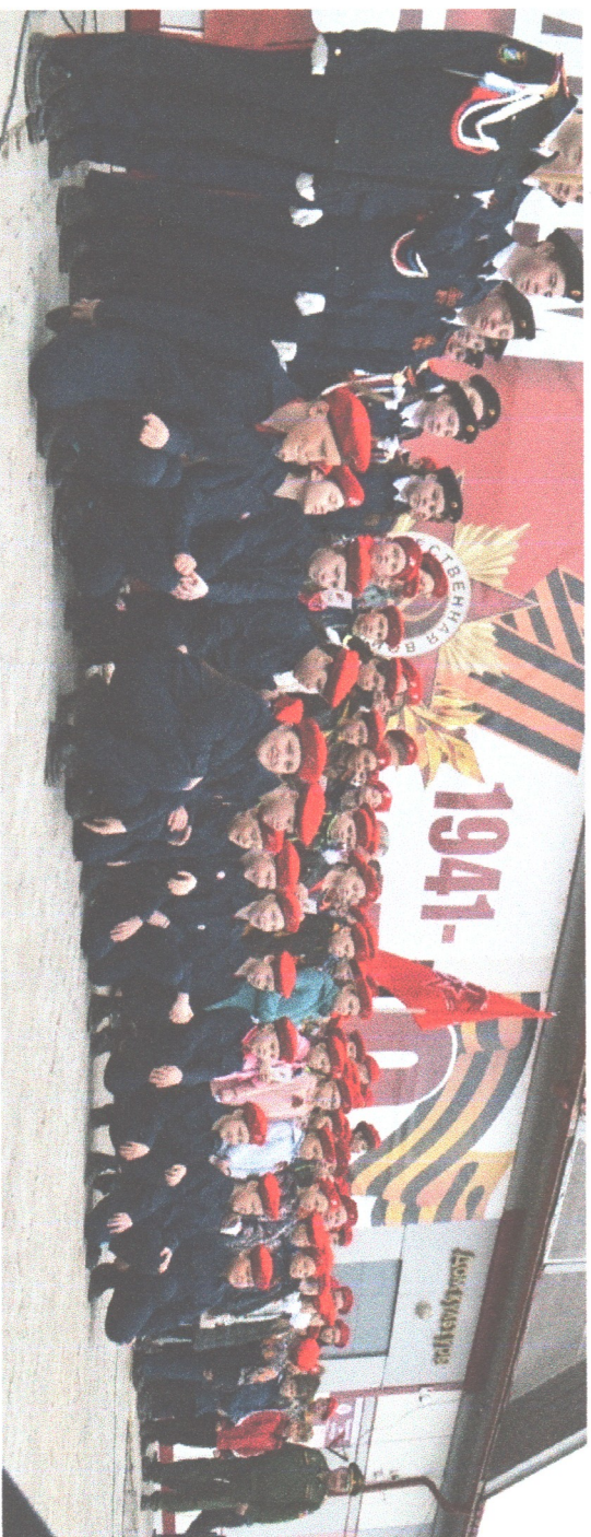
Все юнармейские классы округа