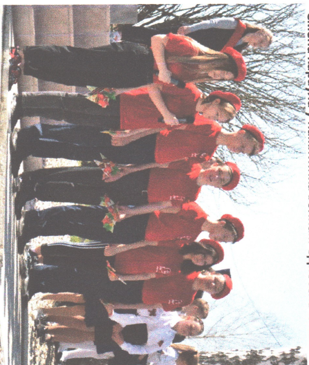
Выступление юнармейцев 8 класса