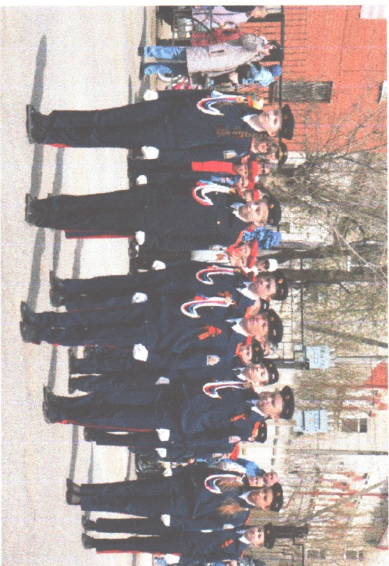
Показательные выступления ашанских кадет