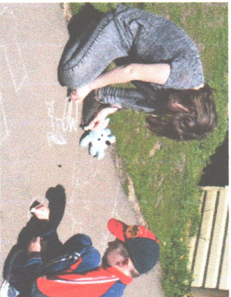
Конкурс рисунков на асфальте