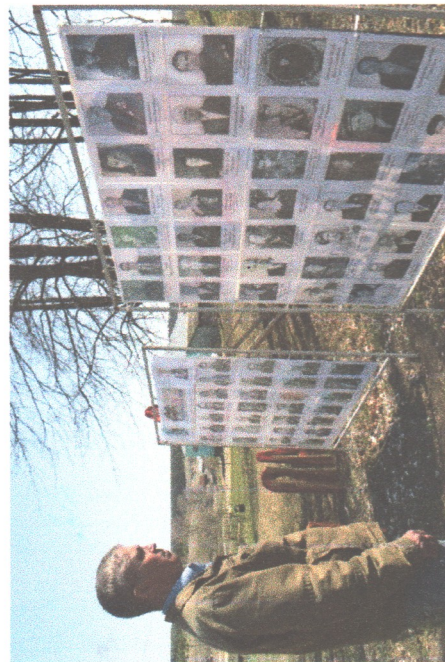
У импровизированной стены памяти